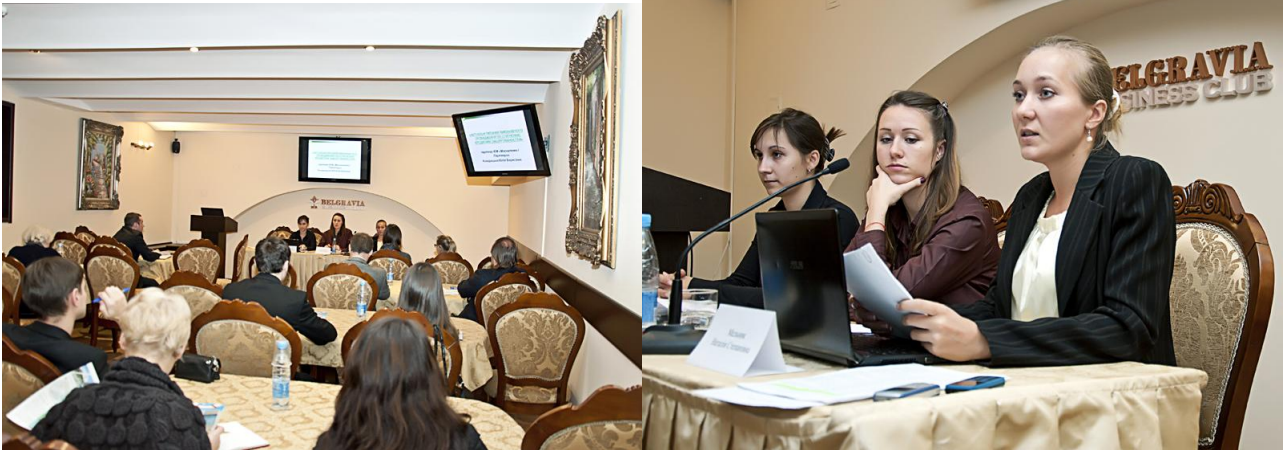
Фотографії III Щорічного семінару «Антикредит: способи позбавитись або зменшити тягар проблемного боргу»